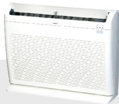
RAF 25~35~50 RPA